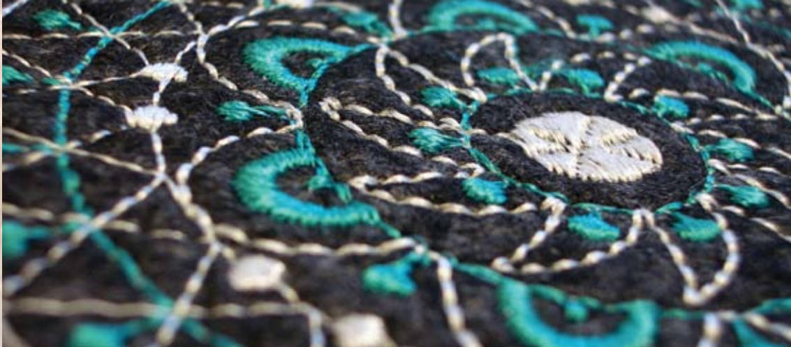
Umgesetztes Stickereimuster - Textilkaufleute